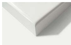
LAK 01 / obvod radius 3 mm rohů stržená hrana

Lakovaná nábytková dvířka standardně vyrábíme ve tvaru LAK 01. Dále je možné vyrobit dvířka hladká, pouze se strženou hranou (LAK 02), nebo v jakémkoliv plošně frézovaném tvaru z nabídky foliovaných dvířek série Classic.