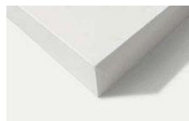
LAK 02 / obvod stržená hrana rohů stržená hrana